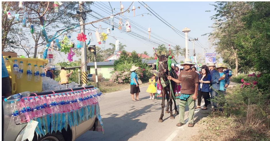
กิจกรรมเดินรณรงค์ ในการร่วมกันรักษาสิ่งแวดล้อม คัดแยกขยะต้นทาง ประกวตรถขยะ