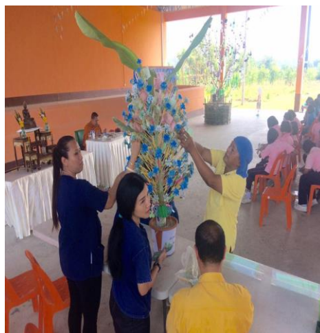
กิจกรรมคัดแยกขยะ ผ้าป่าขยะ